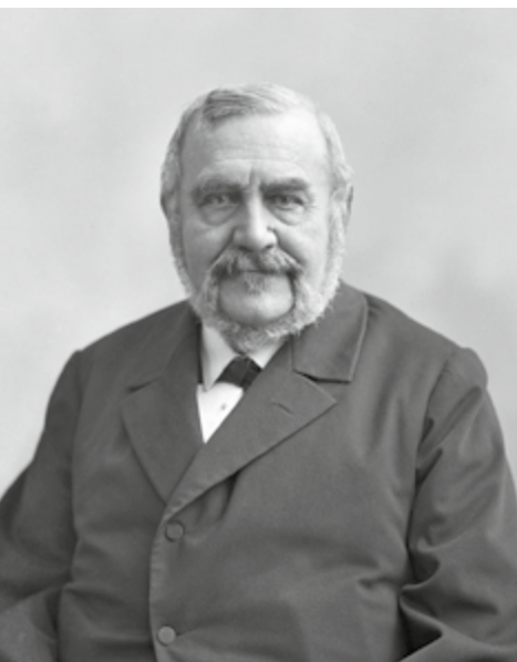
František Ladislav Rieger nebyl jen politik, ale především významný český mecenáš.

Pomáhal i se vznikem Náprstkova průmyslového muzea. Památná je schůzka českých vlastenců v Londýně dne 31. prosince 1862. Během londýnské světové výstavy se zde sešli na dýchánku s Vojtou Náprstkem významní Češi vedení právě Riegrem a domluvili se, že je třeba vzdělávat Čechy v informacích o vědě a technických novinkách. Rieger hned na dýchánku zorganizoval finanční sbírku na nákup učebních prostředků „... kteréž by mohly sloužiti za podklad přednášek populárních, směřujících k povznesení národního blahobytu“. Toho roku pak Náprstek změnil svůj rodný dům na České průmyslové museum, dnes Náprstkovo muzeum, které začal postupně vybavovat exponáty. František Rieger zanechal svou stopu i v dějinách Národního divadla. V roce 1862 coby předseda