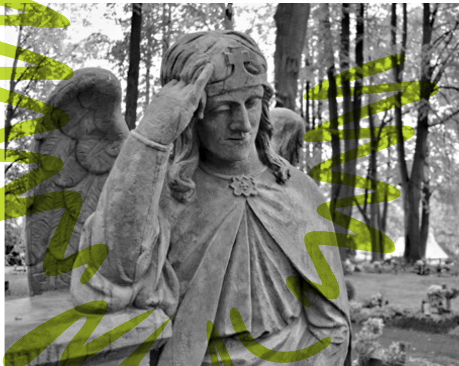
Socha anděla na hřbitově v Jablonném nad Orlicí ochraňuje nejen podnikatele Kvida Štěpánka

Továrník těžce nese, když podnikatelé dostanou například mnohamilionovou evropskou dotaci na stavbu soukromého hotelu uprostřed oploceného areálu golfového hřiště, zatímco nemocnicím schází standardní vybavení.