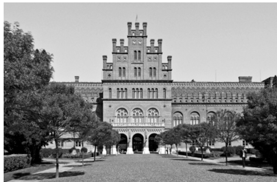
Rezidence bukovinských metropolitů v Černovcích na Ukrajině byla předloni zapsána do seznamu památek UNESCO

Pracoval s takovým nasazením, že si způsobil těžkou chorobu nervového systému, ochrнул a deset let strávil na invalidním vozíku. Přesto neustal v práci, stal se hospodářem na svém statku v Lužanech a znovu se postavil na nohy. Byl dvakrát ženatý, ale obě manželky pochoval a neměl s nimi potomky. Proto musel uvážit, co s nabytým bohatstvím. Třebaže studoval i pracoval většinou ve