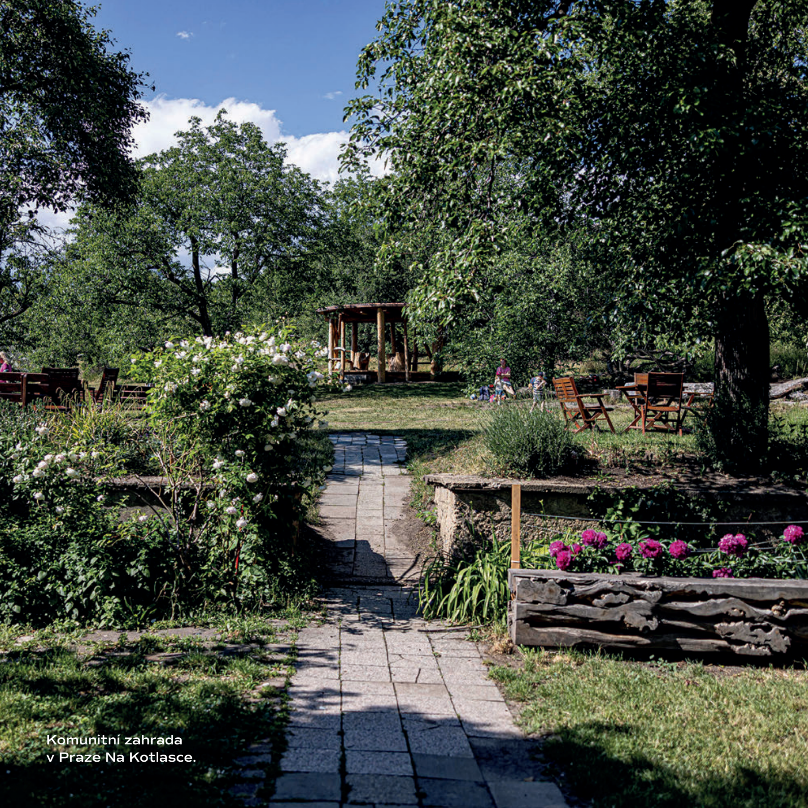
Komunitní zahrada v Praze Na Kotlasce.